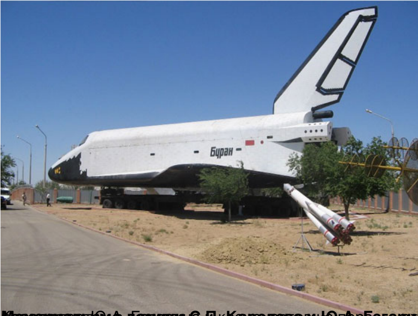
Модель ракеты-носителя «Буран» с космическим кораблем «Буран» на территории космодрома Байконур.