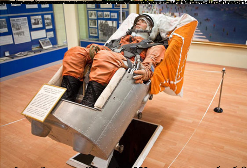
Буран в музее в