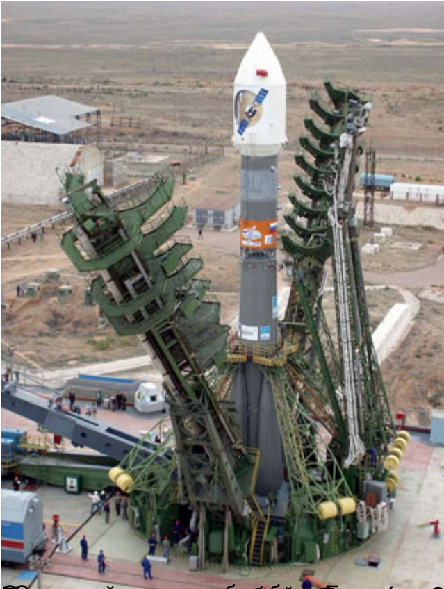
Вид с воздуха на процесс сборки ракеты на мобильной платформе (MLP) для запуска РН