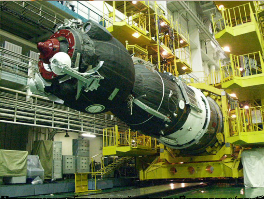
Объект «Буран-ЮВ» на ГРЦ в время