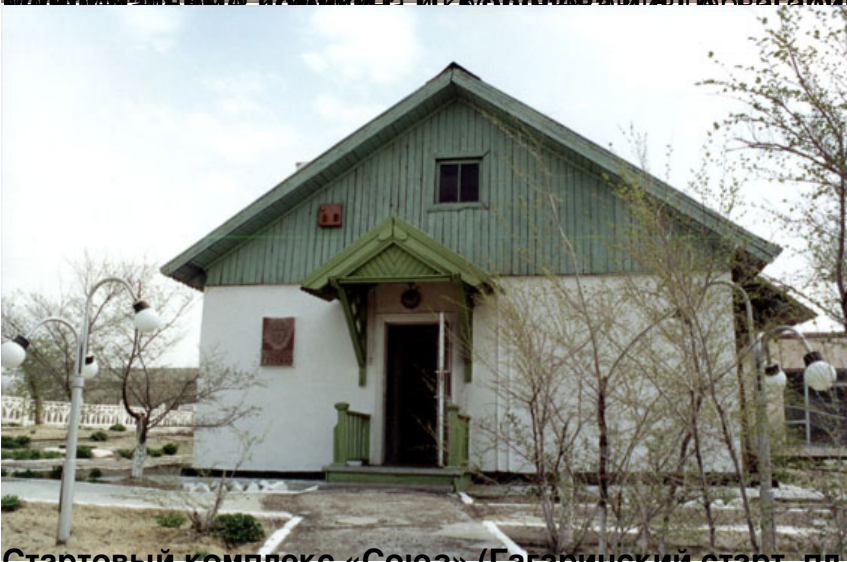
Стартовый комплекс «Союз» (Байконурский стартовый комплекс).